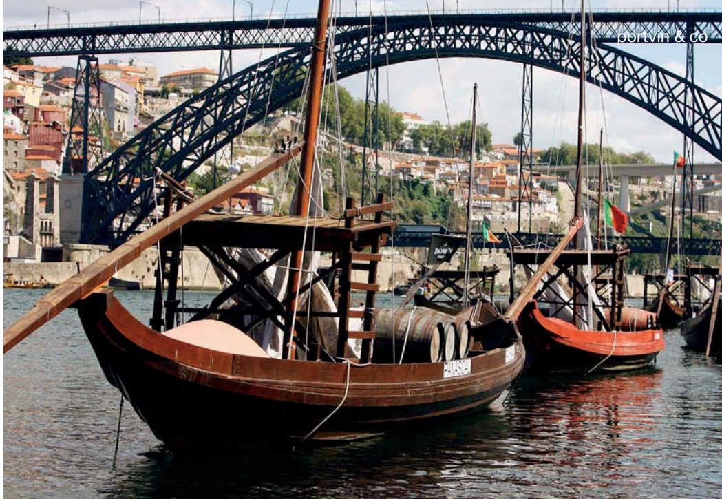
>> De traditionelle portvinsskibe i Oporto – i dag ikke til praktisk brug, men til ære for turisterne og som reklame for de respektive huse. I baggrunden ses Gustav Eiffels bro over Douro-floden.

for deres egen personlige stil, og for portvinsfanatikere plejer det ikke at være det store problem blindt at finde Graham's sødlige stil, Taylor's tørre og strukturerede stil, Quinta do Novals enorme kraft, Dow's slanke og syrede vildskab og Fonsecas fuldendte sammensmeltning af dem alle sammen. Med Dourodalens revolutionære tider er der efterhånden dukket en del potentielle tronranere op, navne uden lang kommerciel baggrund, som med adgang til gamle vinstokke fra små selvstændige quintas laver Vintage Port af imponerende kraft og dybde. Det >